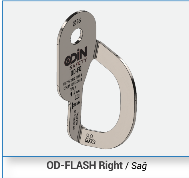
OD-FLASH Right / Sağ