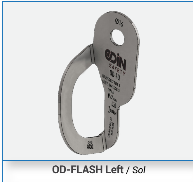
OD-FLASH Left / Sol